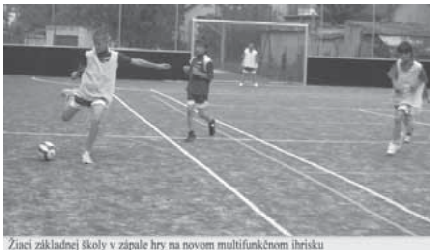
Žiaci základnej školy v zápale hry na novom multifunkčnom ihrisku

Nové multifunkčné ihrisko s umelým povrchom bolo dané do užívania v piatok 6. augusta 2010. Bolo postavené vďaka finančnej podpore Úradu vlády Slovenskej republiky. Od tohto dňa sa tak mládeži, ako aj obyvateľom všetkých vekových kategórií našej obce naskytá možnosť tráviť voľné chvíle športom.