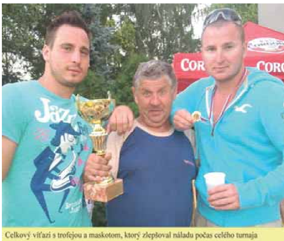
Celkový víťazi s trofejou a maskotom, ktorý zlepšoval náladu počas celého turnaja

Veríme, že náš vodný turnaj sa stane v našej dedine tradíciou a že vzrastie počet zúčastnených výčapsko – opatovských tímov a budeme vďační za každú pomocnú ruku.