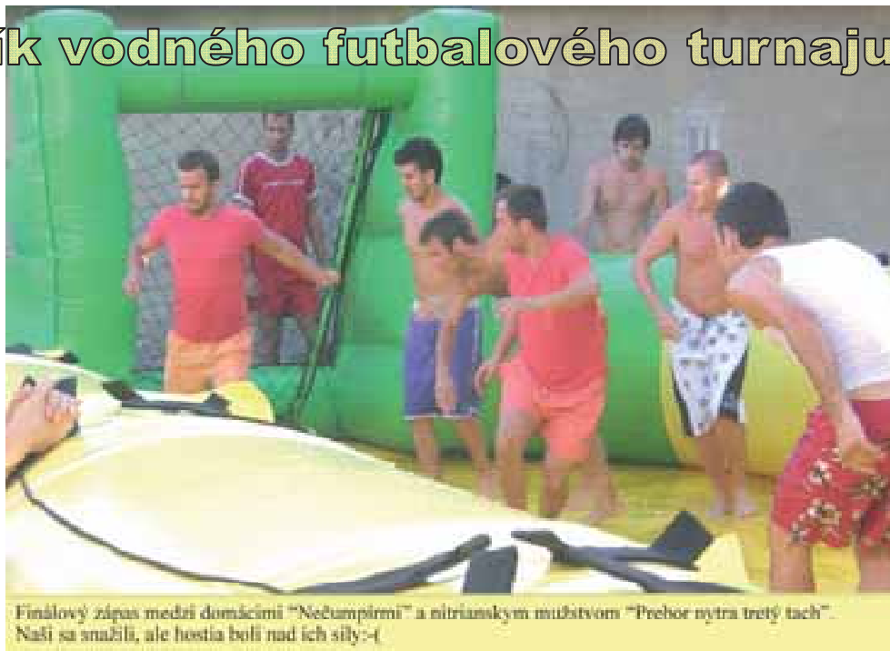
Finálový zápas medzi domácimi „Nečumpíri“ a nitrianskym mužstvom „Prebor nytra tretý tach“. Naši sa snažili, ale hostia boli nad ich sily :-)

Naša predstava o mieste konania tohtoročného vodného futbalu bola na zelenom priestranstve v srdci kultúry našej obci, medzi kultúrnym domom a bývalým kinom, resp. Cinema pub – om, ktorý je na akcie tohto typu priam preurčený. No bohužiaľ, v tejto žiadosti sa nám nevyhovelo. Občania, ktorí bývajú v tejto časti dediny súhlasili a jediné, čo bolo treba urobiť, bolo uzatvoriť jednu z ulíc tak, aby tadiaľ nemohli premávať autá. Len pre porovnanie, na Behu ulicami obce sa zúčastnil porovnateľný počet ľudí ako na Vodnom futbale a nebol problém