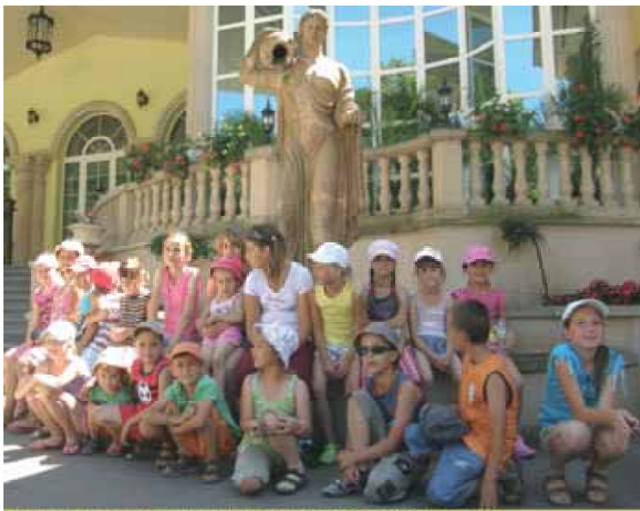
Výčapské „mačiatka“ pred hotelom Aphrodite v Rajeckých Tepliciach

V mene detí sa chcem poďakovať nášmu obecnému zastupiteľstvu, že nám finančne pomohli a uhradili dopravu do Rajeckých Teplíc, pretože by sme si to sami nemohli dovoliť. A rovnaká vďaka patrí všetkým rodičom, ktorí nám pomohli robiť dozor a obetovali svoj voľný čas pre úžasný výlet, ktorý nás bude dlho hriať pri srdiečkach aj v prichádzajúcich chladných časoch.