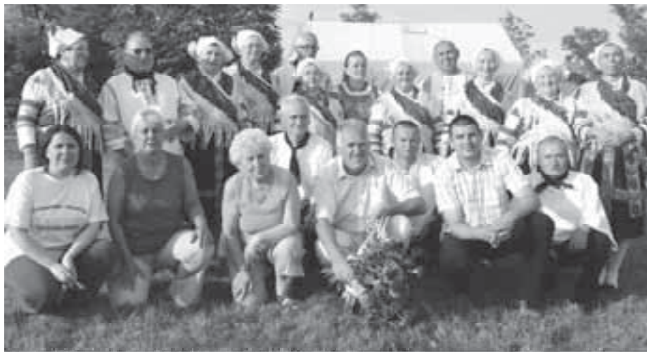
Členovia folklornej skupiny Nefelejcs a predstavitelia obce Vilonya

prípado právo korunovať maďarské kráľovné veszprémkemu biskupovi. Preto sa Veszprém nazýva mestom kráľovien. V katedrále sa nachádza relikvia prvej kráľovnej. Naša prechádzka skončila pri monumentálnych sochách svätého Štefana a blahoslavennej Gizelly. Už len pohľad do údolia, na staré mesto, na krivolaké uličky, na okolitú prírodu. A poďme späť do autobusu, čaká nás cesta do Vilonye.